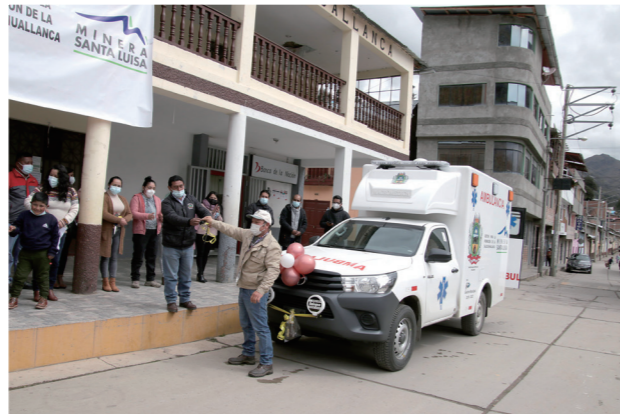
ワジャンカ村への支援物資(救急車)の提供

ワンサラ鉱山・パルカ鉱山を操業するサンタライサ鉱業では鉱山周辺の地域コミュニティとのエンゲージメントを重視し、コミュニティのニーズに沿ったインフラの整備、教育・人材育成の支援、農畜支援を継続的に行なっています。2021年度は救急車と医療用酸素発生器等を寄付し、COVID-19の影響を受けた地域コミュニティを支援しました。