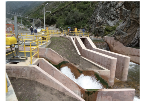
水力発電所の取水口(パルカ鉱山近郊)